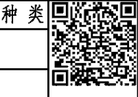
图 号: JQG0224J0-GBS31a03.4-0-3